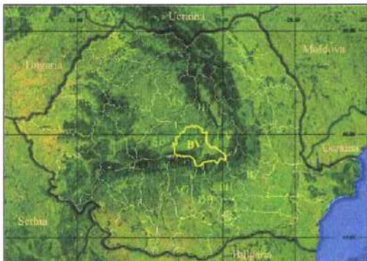
INCADRARE IN TERITORIUL NATIONAL