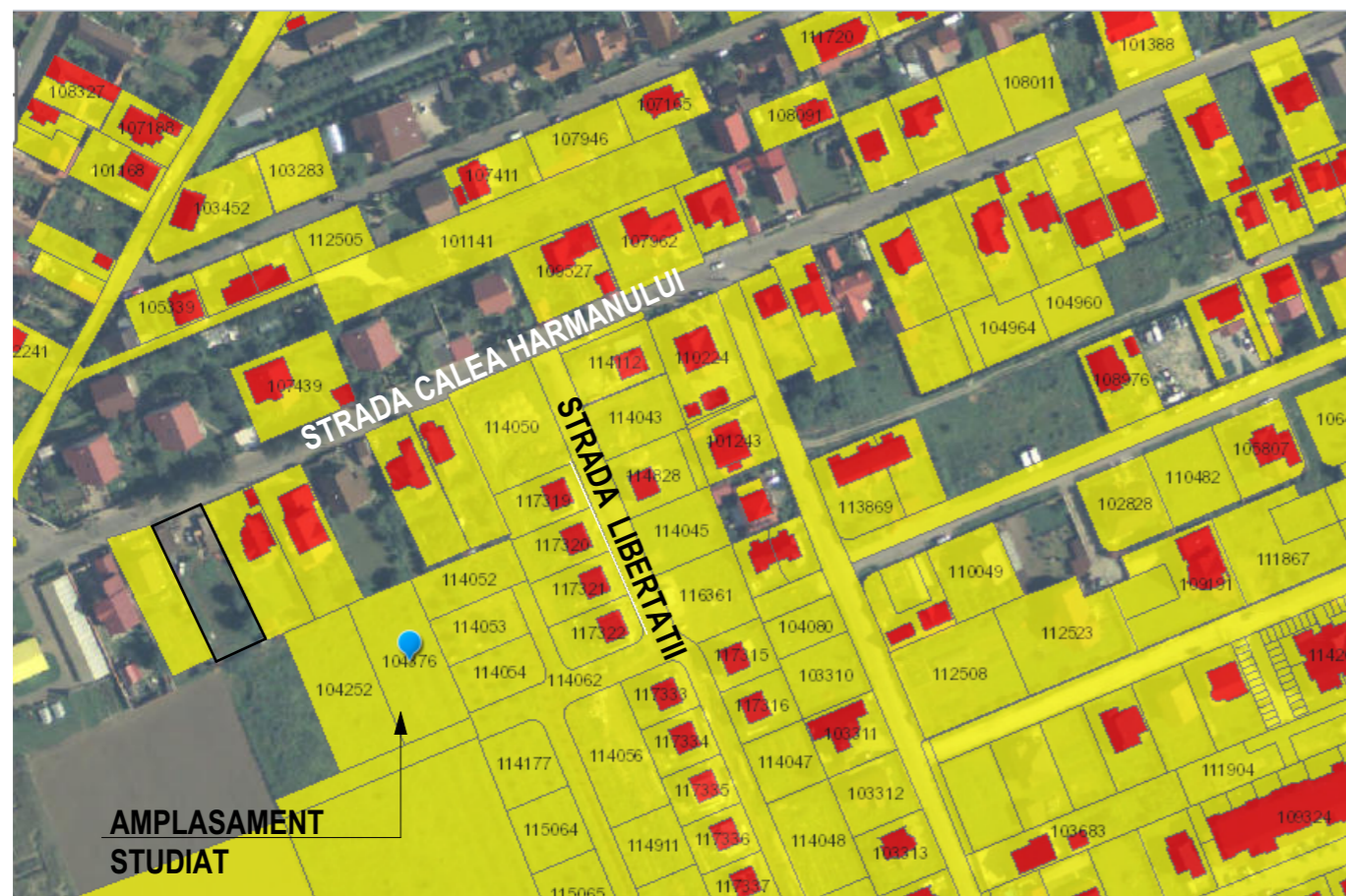
incadrare Imobiliar eterra